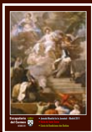
VISIÓN DE SANTA TERESA