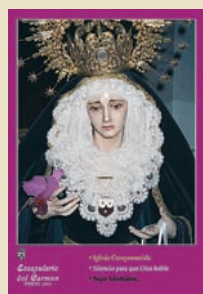
Virgen del Carmen en sus Misterios Dolorosos - SEVILLA -