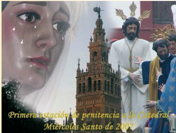
Primera estación de penitencia a la Catedral Miércoles Santo de 2007